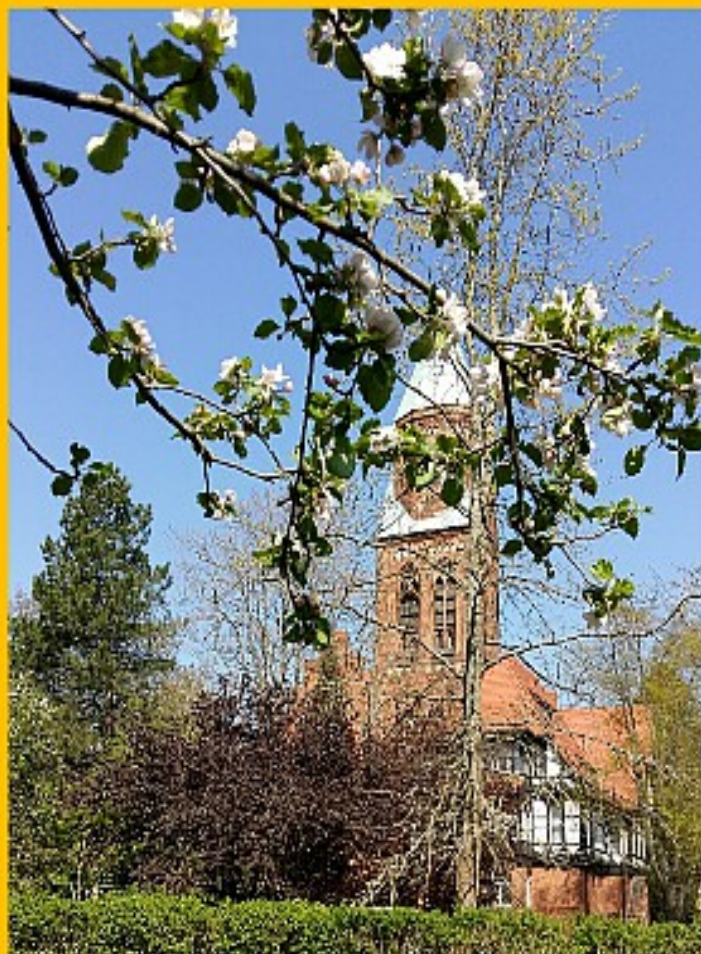
Pfarrei Johannes Bosco - Berliner Südwesten